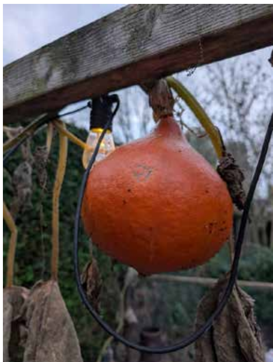
Herfstplaatje in eigen tuin

De top 3 van de inzendingen verdient een leuke prijs. En uiteraard de eeuwige eer van het plaatsen van jouw foto in deze rubriek. Zowel in het wijkblad als op de Instagrampagina.